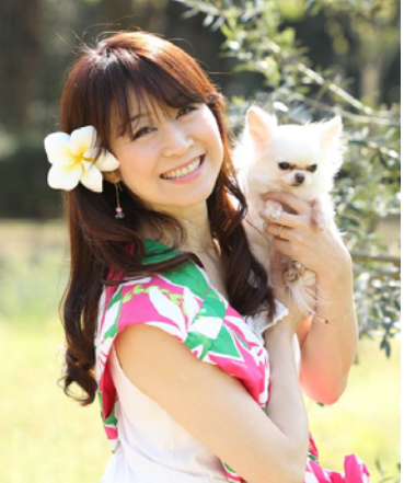
※監修・振付 KIRO-HANA アロハドッグ倶楽部 Facebookページ https://www.facebook.com/arohadog

現在の講師は私しかいませんのでこれから講師を育成していきたいと思っています。まだHPが出来上がっていないので、いろいろお知らせなどはFacebookページでご確認ください。なお、10月19日に行う西武園ゆうえんちの「ワン!ダフルゆうえんち」ステージにてアロハドッグ倶楽部を体験していただけます!